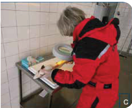
Figur 1. a) Standard telling på båt b) telling i lyskasse c) telling under lupelampe